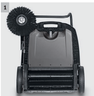
1 Antrieb Hauptkehrwalze